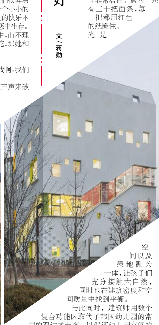
空间以及绿地融为一体，让孩子们充分接触大自然，同时也在建筑密度和空间质量中找到平衡。与此同时，建筑师用数个复合功能区取代了韩国幼儿园的常用双边式走廊，以保证幼儿园空间的高效利用。复合功能区由盘旋而上连接各层的楼梯长廊串联起来，为幼儿园提供了更充足的可利用空间和多样化的教学环境。幼儿园将为儿童提供充满活力的学习空间，让他们在成长中感受自然的变化。复合功能区在承担交通功能的同时，也成为