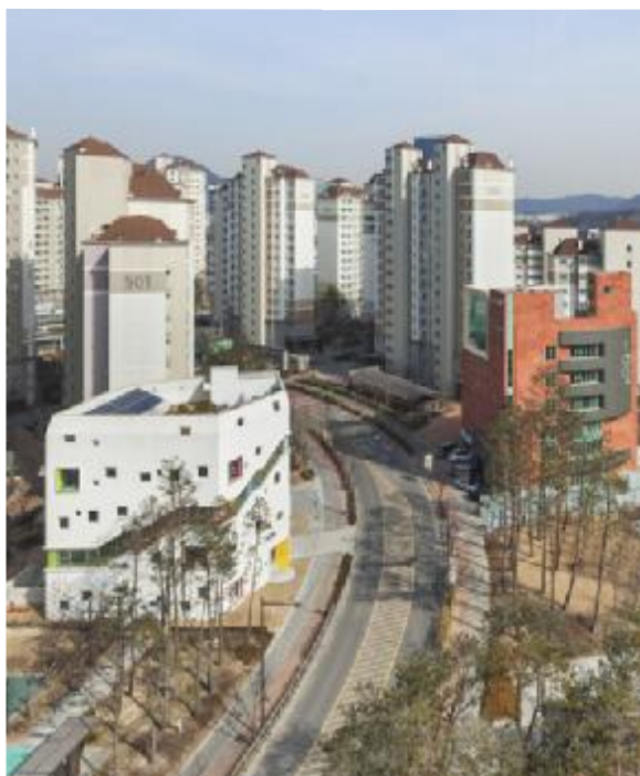
花朵幼儿园项目试图用建筑手段在有限的空间中营造更有利于儿童成长的教育环境，解决这个困扰首尔民众已久的难题。项目位于首尔一个新建的公寓住宅区内，附近有溪流和数个可供儿童安全玩耍的街心公园。幼儿园和周围的开放

视觉上就美得不得了。说明书上写明面条需要煮几分钟，水开了以后再加大冷水，然后再沸一次，不需要加入其他的配料，只要一点点醋或者酱油拌起来就香得不得了。 一个国家的文化可以尊重手工业到如此的程度，让我十分感动，这才是真正的生活美学。