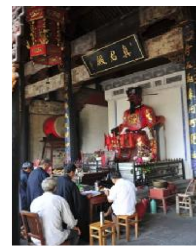
始建年代不详，据说宋代末年已成相当规模。清代光绪三十年捐资重建，耗资三万余金，历时四年竣工。重建殿堂五十多楹，气势恢宏，艺术精美，是一座融合佛教、道教的庙宇。山门匾额“沃洲山”是清代书法家沈鹏所书，大门两旁有黑漆金联：“凭虚天姥谪仙梦，纪实沃洲白傅文”，谪仙就是李白，李白梦游天姥山，写出千古绝唱《梦游天姥吟留别》；白居易的《沃洲山禅院记》属纪实性文章，两位诗人的赞词虚实结合，使得沃洲、天姥名扬天下。

穿岩十九峰位于新昌县城西南廿二公里，它之所以得名是因为高耸的十九座惟妙惟肖的山峰，再因主景马鞍峰顶部有一穿山巨洞，故被冠以穿岩之名。 登上十九峰山顶，欣赏山下村舍和道路点缀在山峰、河流和田园之间的美景的同时，也会发现这些都是两条江水的呵护和润泽之下形成的。任何地方有了河流环绕就会显得灵动，如果是清澈的河水，就似乎沾上了仙气。 仁立山巅，任凭微风吹拂，耳听松涛，眼观山花，别有一番情趣。在这片山顶的下方，有天然石洞贯穿南北，形成一个环境优美、可容纳五百人的石洞，名曰“穿岩洞”，两边都是俯视图下美景的好所在。 自穿岩景区驱车穿过新昌县城，沿104国道往东南方向，十几公里后在一座桥左侧有岔路，路牌书“沃洲湖”。这里是天姥山的核心理带，沃洲、天姥自古就是道教第十五、十六和六十福地，有无数动人的神仙故事和人文胜迹，乃“仙灵之窟宅，烟霞之原委”。这里也是激发唐代诗人创作灵感的地方。《全唐诗》中有关沃洲、天姥的诗有一百多首，这片人杰地灵的山水，在东西晋到唐代的六百多年里，绝对是中国最令人向往的风景旅游区。 四十年前，一座水电站在此建成后，形成沃洲湖，而昔日的潺潺溪江、幽幽小洲已成浩渺碧波，东晋以来建造的一些大寺院及三白堂等胜迹多已沉入湖底。现在湖上有游船，可在欣赏湖光山色的同时，直接到对岸去参观。我没乘船，开车沿着湖边的公路绕湖而行，也是一种乐趣。 对岸的游船码头边有座真君殿，真君殿第二进是前后相通的中